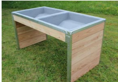
Typ HBS 1

HBE Hochbeeteinsatz (für HB 1.6/08) HBR Rollen für Hochbeet – HBS