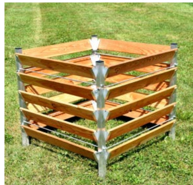
Kompost-Silo Typ K2 Lärche

Wer kleinere Mengen Kompost-Erde braucht, kann die unteren Bretter des Silos entfernen und wieder anbringen. Die Kompost-Silos sind erweiterbar, Anbaufelder können auch nachträglich angebracht werden.