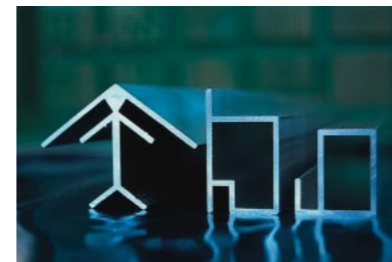
Stabile Profile (2mm Wandstärke) für eine lange Lebensdauer