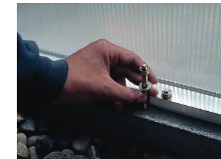
Einfache Befestigung mit Schwerlastdübeln