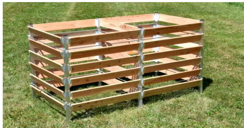
Kompost-Silo Typ K1 Lärche mit Anbaufeld

Gartenabfälle, Gras, Laub, Küchenabfälle mit etwas Humus dazwischen ergeben einen natürlichen Dünger für den Garten und für Topfpflanzen. Heggbacher Kompost-Silos sind leicht und doch stabil. Sie sind zerlegbar und witterungsbeständig, langlebig und mühelos zu versetzen.