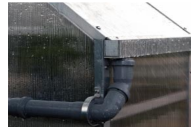
Dachrinnen mit Ablaufstutzen zum Sammeln von Regenwasser