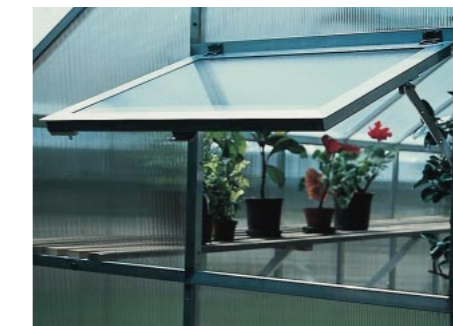
Zubehör: Heckfenster für Gewächshäuser