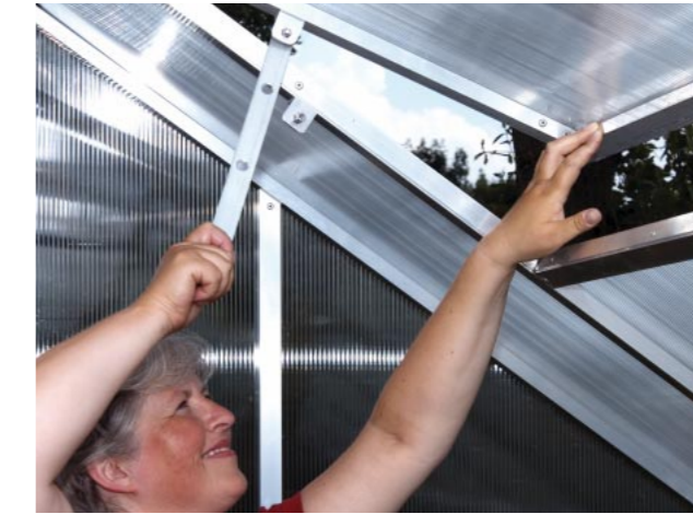
Optimale und einfache Belüftung durch Dachfenster

Einheitliche Traufhöhe 140 cm. Verlängerungen sind um jeweils 50 cm möglich. Max. Länge 600 cm.