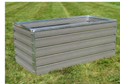
Typ HB 2/08 aus Werzalit