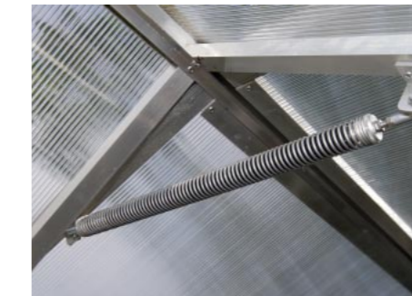
Als Zubehör erhältlich: automatischer Fensteröffner (20 kg Hubkraft)