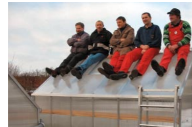
Die halten was aus: maximale Schneelast 100 kg/qm, bezogen auf ein 3m langes Gewächshaus