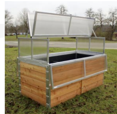
Typ HB 2/08 hier mit HBA 2 Hochbeetaufsatz

Heggbacher Hochbeete sind aus ca. 30 mm starkem Lärchenholz gefertigt, umrahmt mit einem Aluminiumprofil. Die eingearbeitete Folie schützt und hinterlüftet das Lärchenholz. Die Hochbeete sind sehr stabil und hochwertig verarbeitet und in verschiedenen Ausführungen lieferbar.